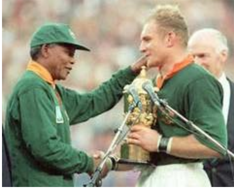
De echte Mandela feliciteert Pienaar met het behalen van de Rugby World Cup in 1995.