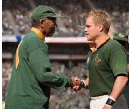
Morgan Freeman als Mandela feliciteert Matt Damon als Pienaar in de film Invictus